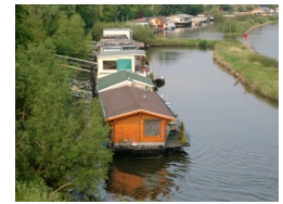
Woonboten in de Rijn bij Arnhem

“Waar is de economie voor het water?” “Bij ongewijzigd beleid worden we steeds efficiënter in het doen van de verkeerde dingen”