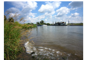
De Maas bij Oeffelt